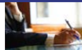
Signature du Contrat Territoire Lecture en octobre dernier.

Dans le cadre d'un premier Contrat Territoire Lecture (CTL), une étude sur le développement de la lecture publique a été soutenue conjointement par le Département de la Vendée et l'État.