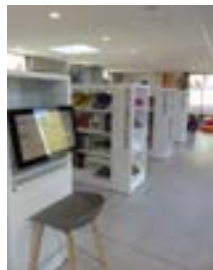
Lumière et perspective

Sont également à disposition : machine à café, jeux de société, fauteuils confortables, terrasse donnant accès au parc... Depuis l'ouverture, le public de la médiathèque s'est élargi (retour des bébés-lecteurs, des seniors et des adolescents). Ainsi, les usagers s'approprient le lieu. Ils restent plus longtemps pour discuter, boire un café ou simplement lire.