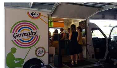
Le Groupe de Travail Numérique départemental a découvert le café numérique mobile Germaine qui propose des outils et des services de type fablab.

Le fablab, quant à lui, peut tout à fait être un partenaire de la bibliothèque dans le cadre d'animations spécifiques (découverte des outils, semaine du numérique...). Il apportera ses compétences techniques et son propre matériel au service des projets de la bibliothèque.